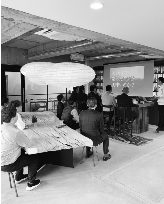
会社説明を聴講している参加者の様子

2月5日 国内研修 / (株)サンウエスパ本社 (岐阜市岩田西3-429) 会社見学 午後3時 開始 参加者12名