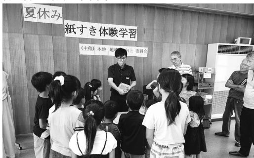
紙すき体験の様子