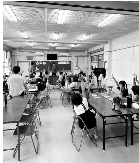
城北小授業(座学)の様子